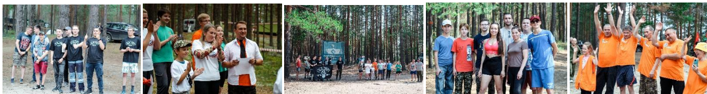
На юбилейный слет были приглашены ветераны первых турслетов Коми филиала.

На турслет съехались 5 команд: команда Сервисного центра г. Ухта «В Зю Зю ТОП», команда «МIX поколение» – Технический блок, сборная команда Цеха транспортного обеспечения «СТОбаллов» из Сыктывкара, команда IT «Туристы» и «М@стера» Станционного участка с. Объячево.